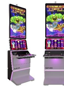
DIMENSION TOP Box