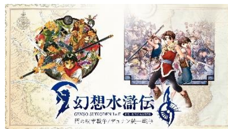
幻想水滸伝 I&II HDリマスター 門の紋章戦争 / デュナン統一戦争