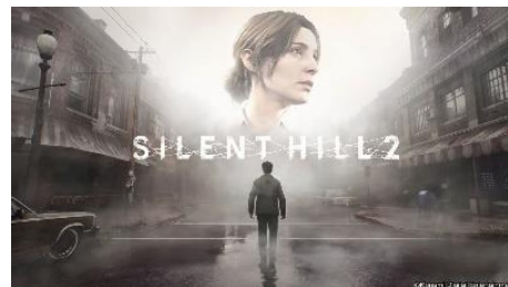
SILENT HILL 2

※ DE: デジタルエンタテインメント事業 “PlayStation”は、株式会社ソニー・インタラクティブエンタテインメントの登録商標または商標です。 Nintendo Switch のロゴ・Nintendo Switch は任天堂の商標です。