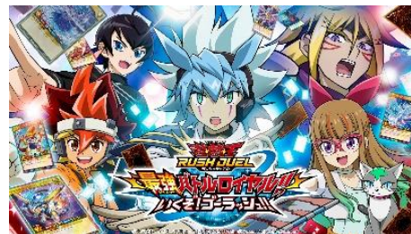
遊戯王ラッシュデュエル 最強バトルロイヤル!! いくぞ!ゴーラッシュ!!