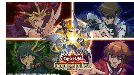
遊戯王クロスデュエル