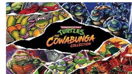
Teenage Mutant Ninja Turtles: The Cowabunga Collection