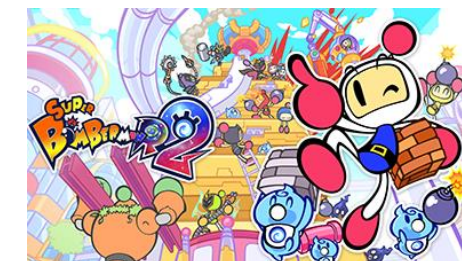
スーパーボンバーマン R 2